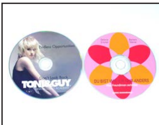
Offset (links) und Siebdruck (rechts). Fotorealistische Farbverläufe (Offset) vs. kräftige Farben (Siebdruck)