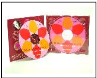
CD Digipack 4seitig