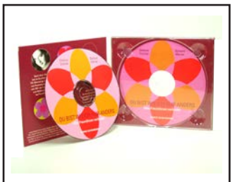
CD Digipack 4seitig