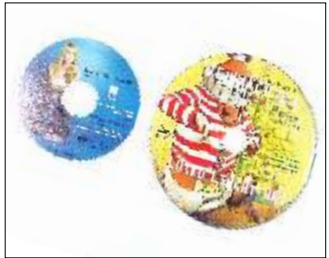
12cm CD und 8cm CD im Vergleich