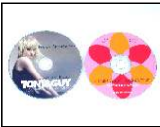
Offset (links) und Siebdruck (rechts). Fotorealistische Farbverläufe (Offset) vs. kräftige Farben (Siebdruck)