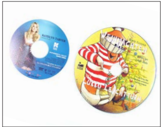
12cm CD und 8cm CD im Vergleich